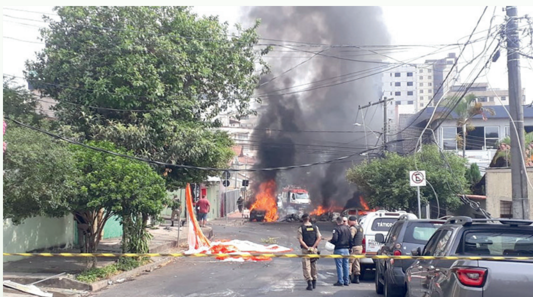
O último acidente que matou quatro pessoas